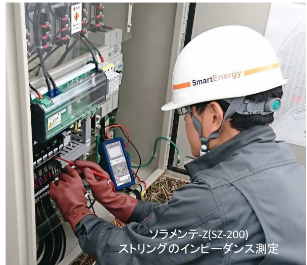
ソラメンテ-Z(SZ-200) ストリングのインピーダンス測定

また操作性の良さとあいまって点検結果が明確で点検者のスキルに依存しないメリットもある。これは全国展開する上では特に重要なポイントになる。さらに可搬性に優れている点も作業効率に大きく貢献している。