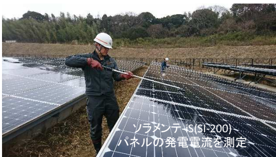
ソラメンテ-iS(SI-200) パネルの発電電流を測定