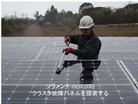
ソラメンテ-iS(SI-200) クラスタ故障パネルを探索する