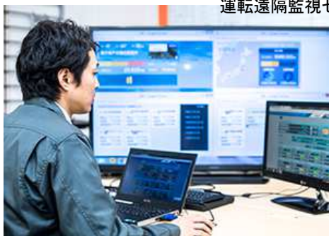
運転遠隔監視センター

これらの電気関係のノウハウをベースとしながら、従来の草刈等の管理業務に亘るまでカバーしている。自社のノウハウを協力会社にも展開し、全国対応できる充実した体制作りを進めている。発電事業者にとって、太陽光発電設備のO&Mをトータルで提案できる技術力が、非常に魅力的であると感じた。