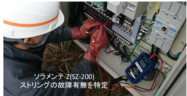
ソラメンテ-Z(SZ-200) ストリングの故障有無を特定